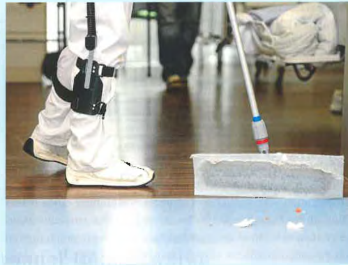
Das Ergebnis des staubbindenden Wischens im Patientenzimmer ist am Mopp deutlich zu erkennen.