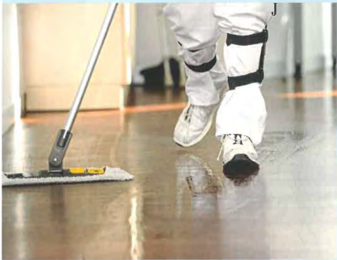
Fußbodenreinigung im herkömmlichen Nasswischverfahren.