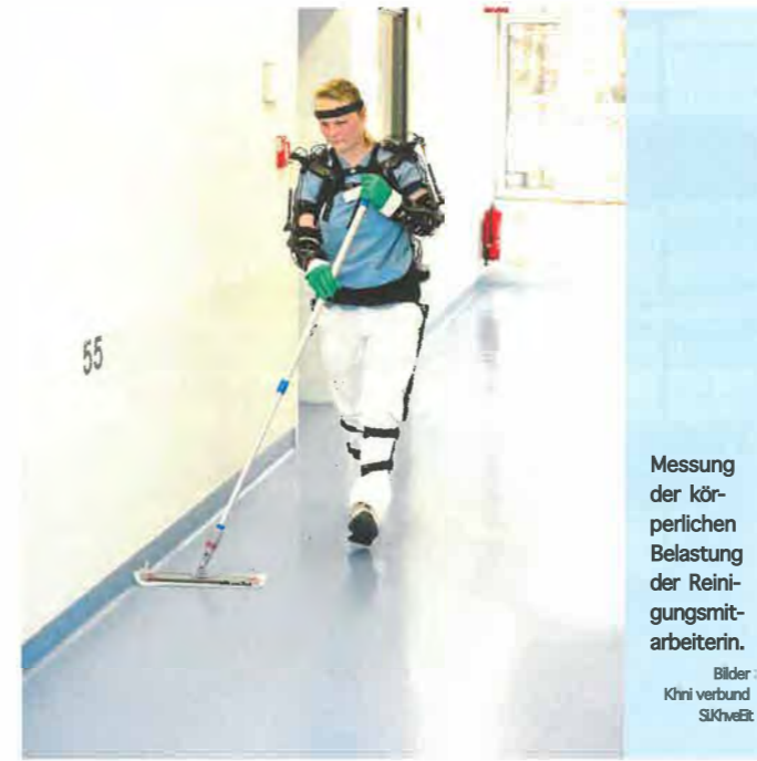
Messung der körperlichen Belastung der Reinigungsmitarbeiterin.