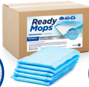
Klettstoff für Kletthalter