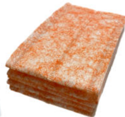
Klettstoff für Kletthalter