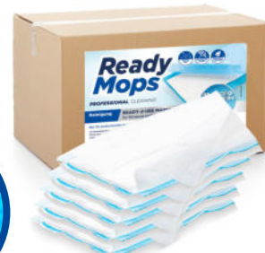
Für Kletthalter, Swiffer*, Handpad