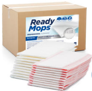
Klettstoff für Kletthalter