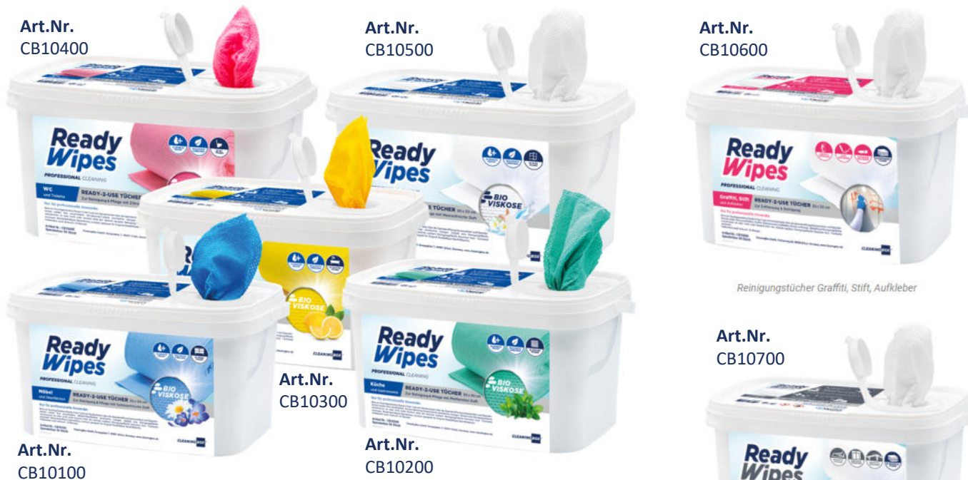
Reinigungstücher Graffiti, Stift, Aufkleber

✓ Gebrauchsfertig ✓ Kompostierbar aus Viskose ✓ Streifenfrei ✓ Tolle Düfte ✓ 5-Farbsystem ✓ Nachfüllbar